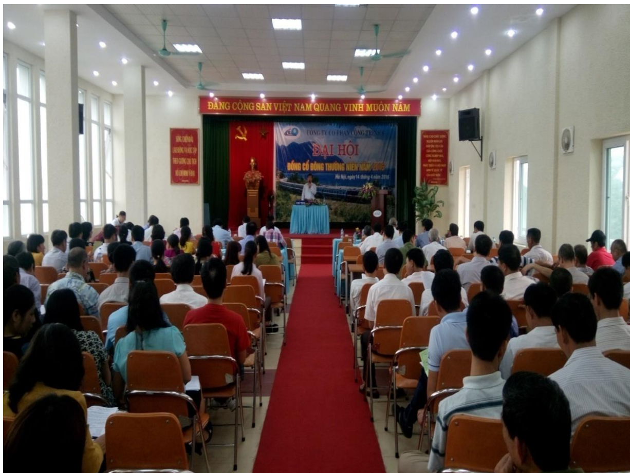
Đại hội đồng cổ đông thường niên 2017