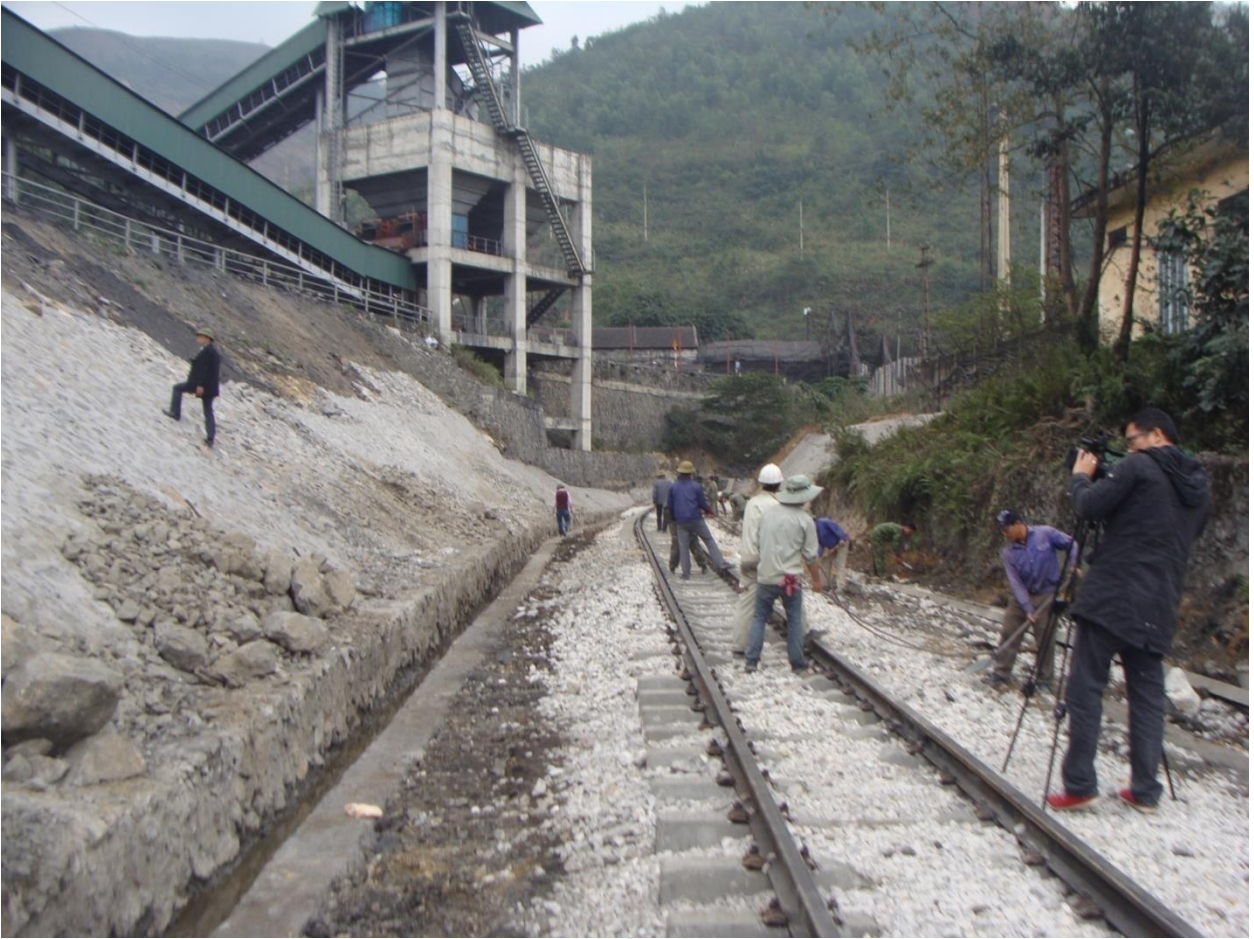
* Hình ảnh thi công công trình đường sắt trên cao Cát Linh Hà Đông 2016: