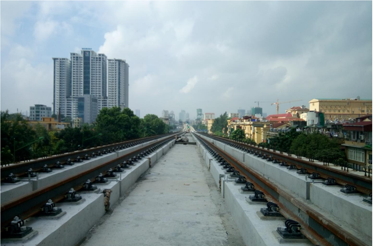
* Hình ảnh sản xuất Tà vẹt bê tông dự ứng lực tại Cổ Loa Đông Anh :