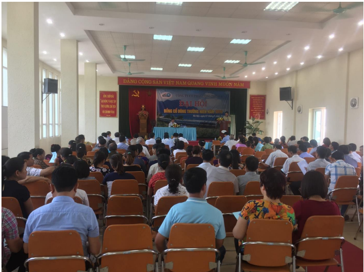
Đại hội đồng cổ đông thường niên 2019